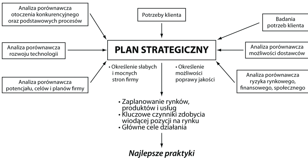
Rysunek 8.1. Plan strategiczny