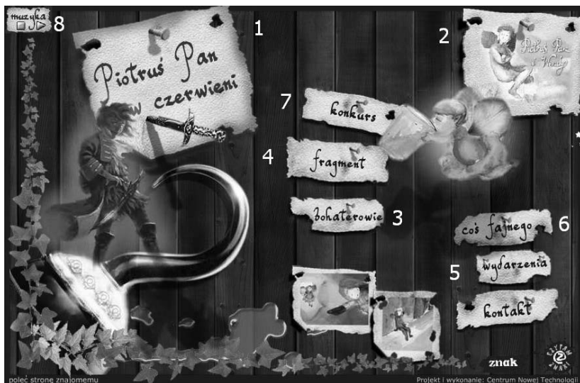
Rysunek 3.2. Piotruspan.znak.com.pl — przykład strony produktowej

unowocześniające produkt), instrukcje obsługi (nie każdy lubi przechowywać pudełka z instrukcją do produktu), ciekawe dodatki stanowiące wartość dodaną, np. tapety na pulpit komputera.