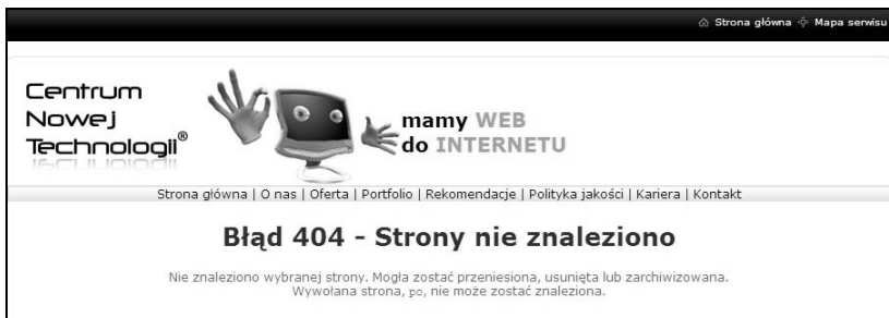
Rysunek 3.4. Jak radzić sobie z błędem 404

gdy wpisze błędnie adres strony. Takie złe wrażenie można jednak zniwelować. Wystarczy, że pod adres domeny ustawisz wyświetlanie się góry strony wraz z menu, bez względu na to, jaki nieprawidłowy adres podstrony by się wpisało w pasek przeglądarki. Posłużę się przykładem strony mojej firmy. Portfolio jest dostępne pod adresem www.cntech.pl/portfolio , lecz gdyby podczas wpisywania adresu namieszał jakiś chochlik i zamiast „portfolio” byłoby słowo „portolio”, pojawi się strona z naszym logo, hasłem, menu oraz standardowym komunikatem, że strona nie została odnaleziona (rysunek 3.4). Dzięki widocznemu i aktywnemu menu można próbować ją odnaleźć. Przede wszystkim jednak użytkownik otrzymuje jasny sygnał: strona wciąż działa, co w przypadku strony firmowej oznacza: „jeszcze się nie zwinęli”.