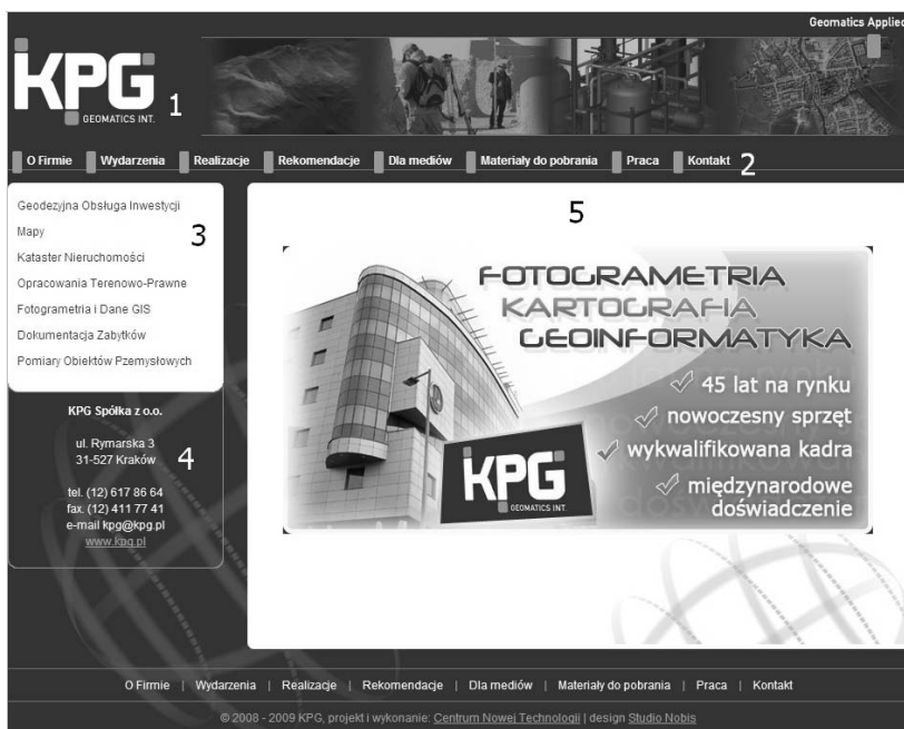
Rysunek 3.1. Kpg.pl — przykład strony firmowej

Opis do rysunku 3.1 przedstawiającego stronę www.kpg.pl firmy, która jest czołowym dostawcą usług geodezyjnych w Polsce: