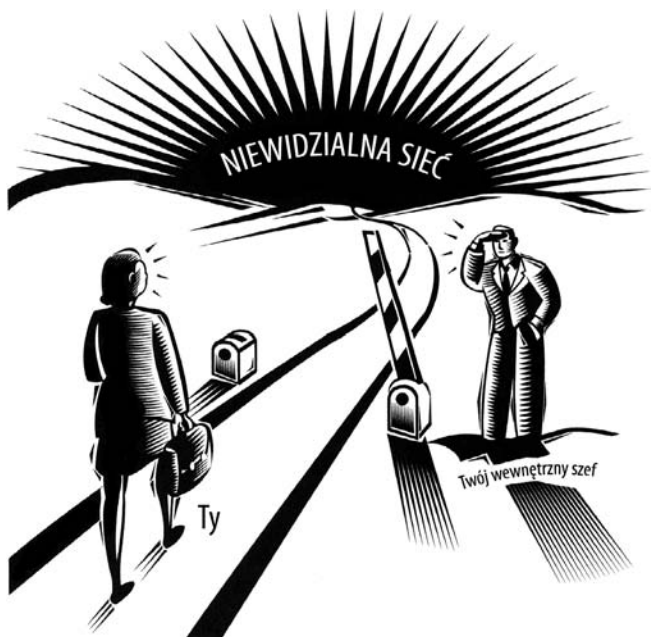
RYСУNEK 1.1. Twój wewnętrzny szef sprawuje kontrolę nad dostępem do niewidzialnej sieci i zarządza przepływem informacji między Tobą a siecią

Pośród wielu funkcji, jakie pełni Twój wewnętrzny szef, znajdują się takie, jak kontrola dostępu do niewidzialnej sieci (podobnie jak ISP) i zarządzanie przepływem informacji i komunikatów do oraz z sieci w Twoim imieniu. Twój wewnętrzny szef jest strażnikiem, który musi mieć wgląd we wszelkie informacje i komunikaty, zanim przedostaną się one do sieci lub staną się dostępne dla Ciebie (rysunek 1.1).