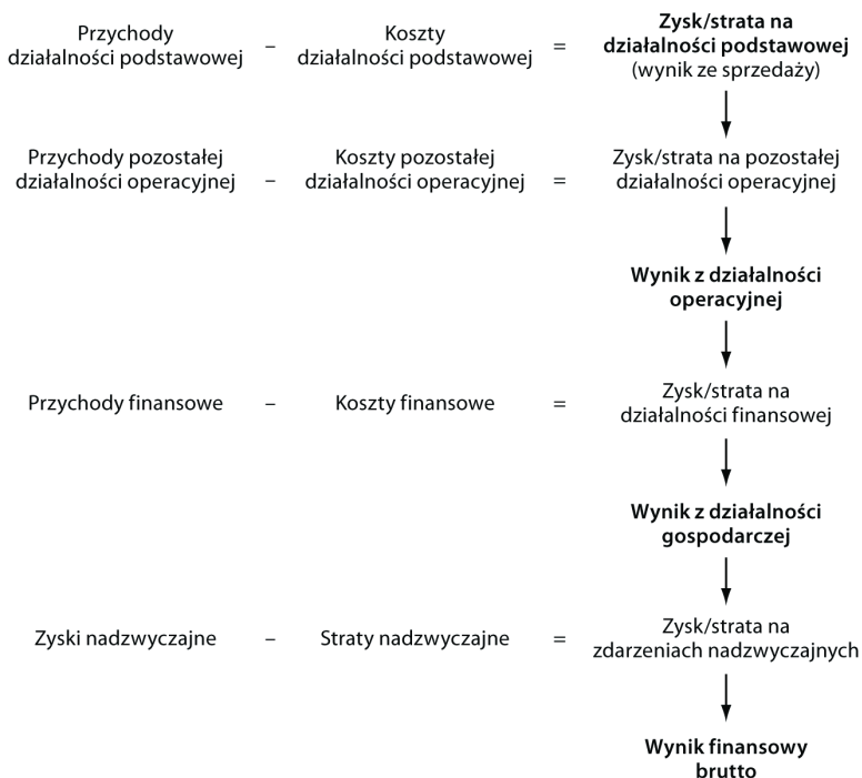
Schemat 3.1. Struktura rachunku zysków i strat według segmentów działalności

Na każdej z tych grup możemy obliczyć wypracowany przez przedsiębiorstwo zysk lub stratę. Schemat 3.1 przedstawia strukturę rachunku zysków i strat.