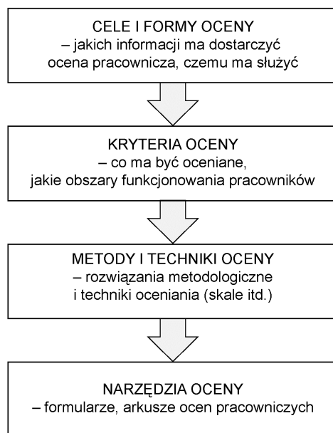
Rysunek 4.1. Hierarchia i kolejność „elementów” okresowej oceny pracowniczej — każdy niższy poziom musi wpływać z wyższego i być z nim zgodny.

Właściwie sformułowane kryteria ocen pracowniczych spełniają następujące warunki: