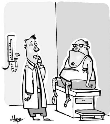
TESTY WYKAZAŁY, ŻE MA PAN NADAKTYWNY GRUCZOŁ ZZRĘDZENIA

szczęścia jest mniej więcej w 50% zależny od genów, a w 50% wyuczony. Innymi słowy, jeśli generalnie jesteś radosny lub wiecznie ponury, to w połowie jest tak dlatego, że taki się urodziłeś , a druga połowa zależy od Twoich myśli, uczuć i przekonań, uformowanych w odpowiedzi na Twoje życiowe doświadczenia.