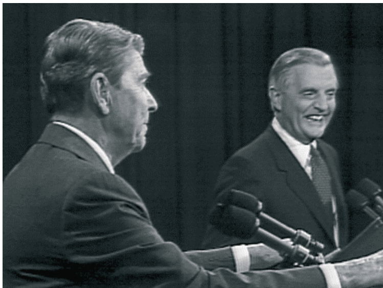
Rysunek 7.3. Ronald Reagan wykonuje mistrzowskie ścięcie w stronę Waltera Mondale'a

Nawet jego przeciwnik, senator Mondale, zrozumiał, że stoi przed prawdziwym mistrzem tej gry i wybuchnął śmiechem razem ze wszystkimi na widowni (rysunek 7.3).