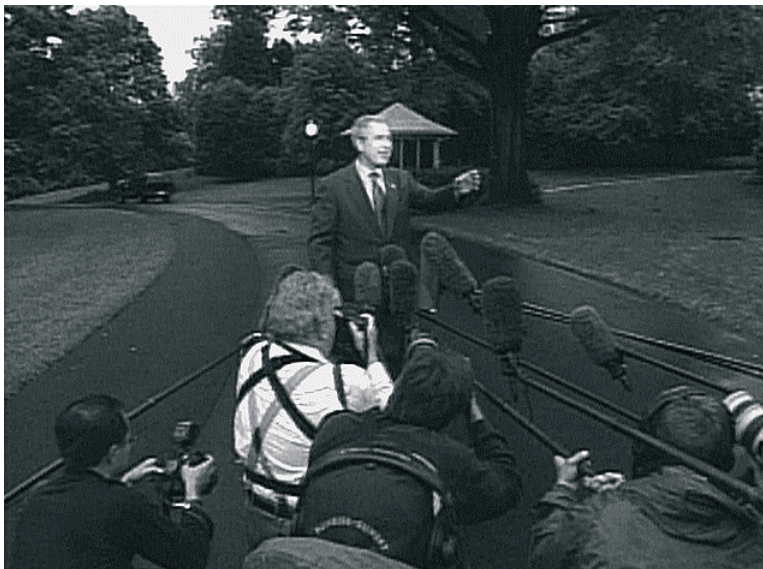
Rysunek 7.1. George W. Bush na zwołanej przez siebie konferencji prasowej

W odpowiedzi na pytanie dziennikarza o szanse na reelekcję, Bush stwierdził: