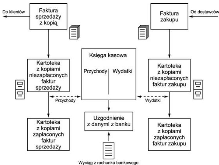
Rysunek 6.2. Prosty system księgowania

Na przykład w omawianym przypadku wyciąg z rachunku bankowego uzyskany pod koniec czerwca powinien wskazywać na kwotę 808,14 zł. Na rysunku 6.2 przedstawiono, w jaki sposób działa tego typu system.