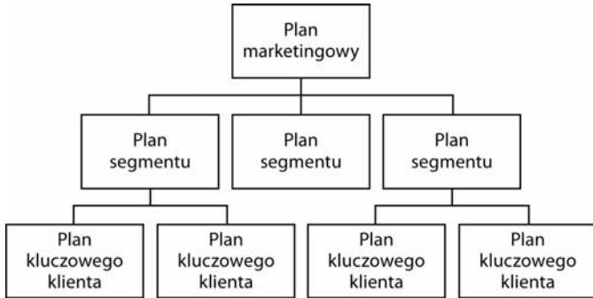
Rysunek 5.1. Typowa hierarchia procesu planowania

Jeżeli jednak żadna z powyższych uwag nie dotyczy Was i naprawdę macie dobrze udokumentowane plany dla rynków i segmentów, to już na starcie dysponujecie olbrzymią przewagą, jeśli chodzi o identyfikowanie kluczowych klientów. Tak wielką, że w zasadzie to, co nazywam w niniejszym procesie krokiem piątym, Wy już od dawna macie za sobą. W swoim biznesplanie określiliście cele swoich planów marketingowych, a Wasi kluczowi klienci zostali objęci planami dla poszczególnych segmentów. Rysunek 5.1 przedstawia typową hierarchię procesu planowania.