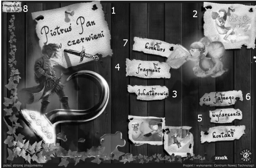
Rysunek 3.2. Piotruspan.znak.com.pl — przykład strony produktowej

unowocześniające produkt), instrukcje obsługi (nie każdy lubi przechowywać pudełka z instrukcją do produktu), ciekawe dodatki stanowiące wartość dodaną, np. tapety na pulpit komputera.