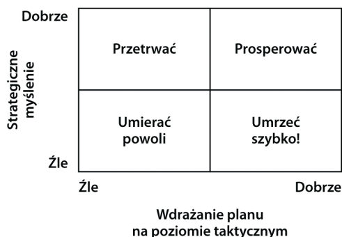
Rysunek 6.1. Dlaczego plan marketingowy jest potrzebny?

Istnieje wiele powodów. Podam Ci tylko 10. Jednak bardziej przekonujący niż lista powodów powinien być dla Ciebie rysunek 6.1 (wprawdzie jest to czteropolowa macierz, ale ma ręce i nogi!).