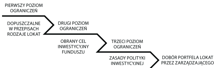
RYSUNEK 2.1. Czynniki determinujące sposób inwestowania aktywów funduszu

Aby nasza ocena była wyważona i właściwa nie możemy zapominać o tym, że sposób inwestowania aktywów funduszu jest zawsze wypadkową czterech elementów: dopuszczalnych prawem form lokat, przyjętego przez fundusz celu inwestycyjnego, sposobu dojścia do tego celu, czyli zasad polityki inwestycyjnej, oraz decyzji o doborze lokat, podejmowanej przez osoby zarządzające funduszem (rysunek 2.1).