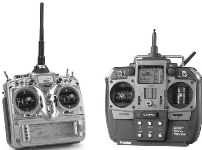
Rysunek 2.9. Nadajniki zdalnego sterowania

Do drona powinna być dołączona dokumentacja określająca współpracujące z nim nadajniki. Jeżeli nie możesz znaleźć tych informacji w instrukcji obsługi lub w internecie, to wstrzymaj się z zakupem nadajnika. Nadajnik niekompatybilny z Twoim dronem może tylko pełnić funkcję balastu lub dzieła sztuki współczesnej. Na rysunku 2.9 pokazano dwa nadajniki zdalnego sterowania, które mogą być używane do sterowania różnymi dronami.