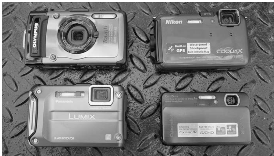
Rysunek 2.6. Aparaty kompaktowe wyglądają słodko

Aparaty kompaktowe to tania przepustka do świata wideo. Większość aparatów tego typu umożliwia rejestrowanie obrazu. Jeżeli dopiero zaczynasz interesować się filmowaniem, to jest to dobre rozwiązanie umożliwiające rozpoczęcie przygody z filmowaniem bez ponoszenia dużych kosztów. Obraz w stosunku do ceny i dostępnych funkcji jest fantastyczny, ale nie zaspokoi on potrzeb doświadczonego fotografa. Na rysunku 2.6 pokazano kilka aparatów kompaktowych o małych i średnich rozmiarach.