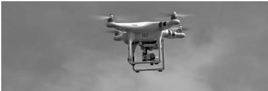
Rysunek 2.3. Dron DJI Phantom 2 Vision wyposażony w kamerę