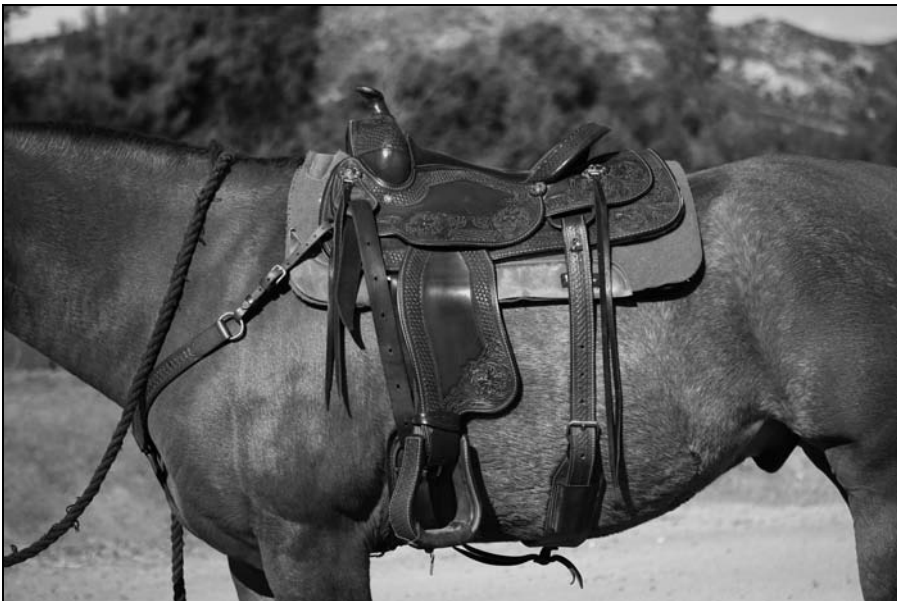
Rysunek 11.6. Prawidłowo umiejscowione siodło typu western

Ustaw się po lewej stronie konia i unieś siodło ku górze i nad konia. Nałóż je delikatnie na koński grzbiet. Siodło powinno znaleźć się w przestrzeni poniżej kłębu. Należy je umieścić w taki sposób, aby z przodu i z tyłu wystawało spod niego po około 8 centymetrów czapraka. Aby potwierdzić prawidłowe ułożenie siodła na końskim grzbiecie, należy sprawdzić, czy popręg po zamocowaniu znajdzie się tuż za stawami łokciowymi (na rysunku 11.6 przedstawione zostało prawidłowe umiejscowienie siodła typu western).